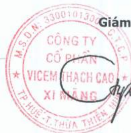
Trương Phú Cường